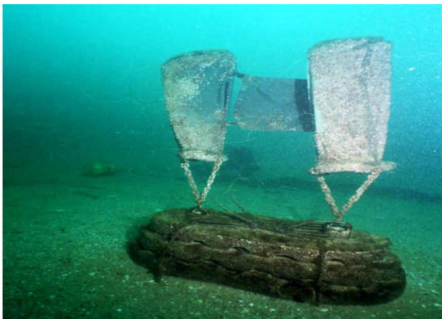
Рис.3. Донно-пелагическая рифовая биостанция «Сарматская»

Биостанция состояла из донной и пелагической частей (рис.3). Донная была изготовлена из нейтрального бетона и состояла из нескольких прослоек с убежищами, а пелагическая часть рифа представляла собой два полипропиленовых мешка емкостью по 0,5 м 3 , заполненные пластиковыми емкостями с воздухом для положительной плавучести.