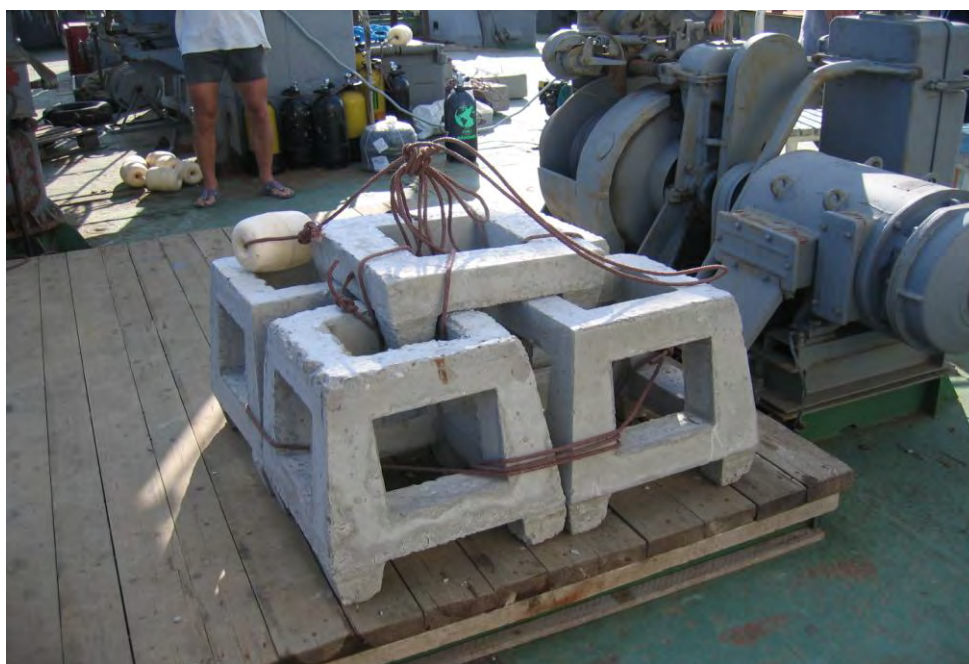
Рис.2. Модульная донная рифовая биостанция